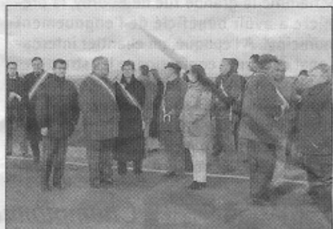
Les élus étaient venus nombreux lors de la dernière manifestation.